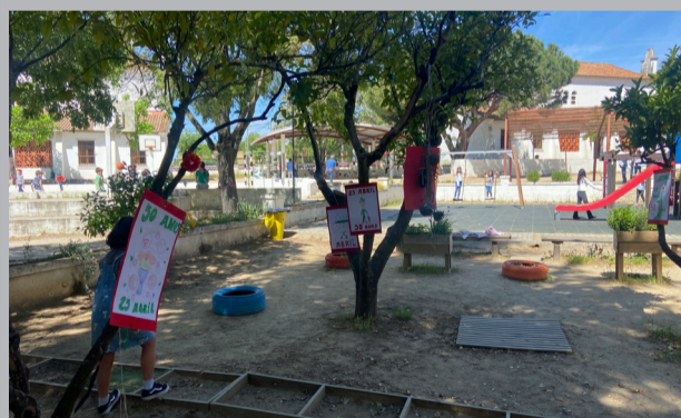
EB do Rossio de São Brás